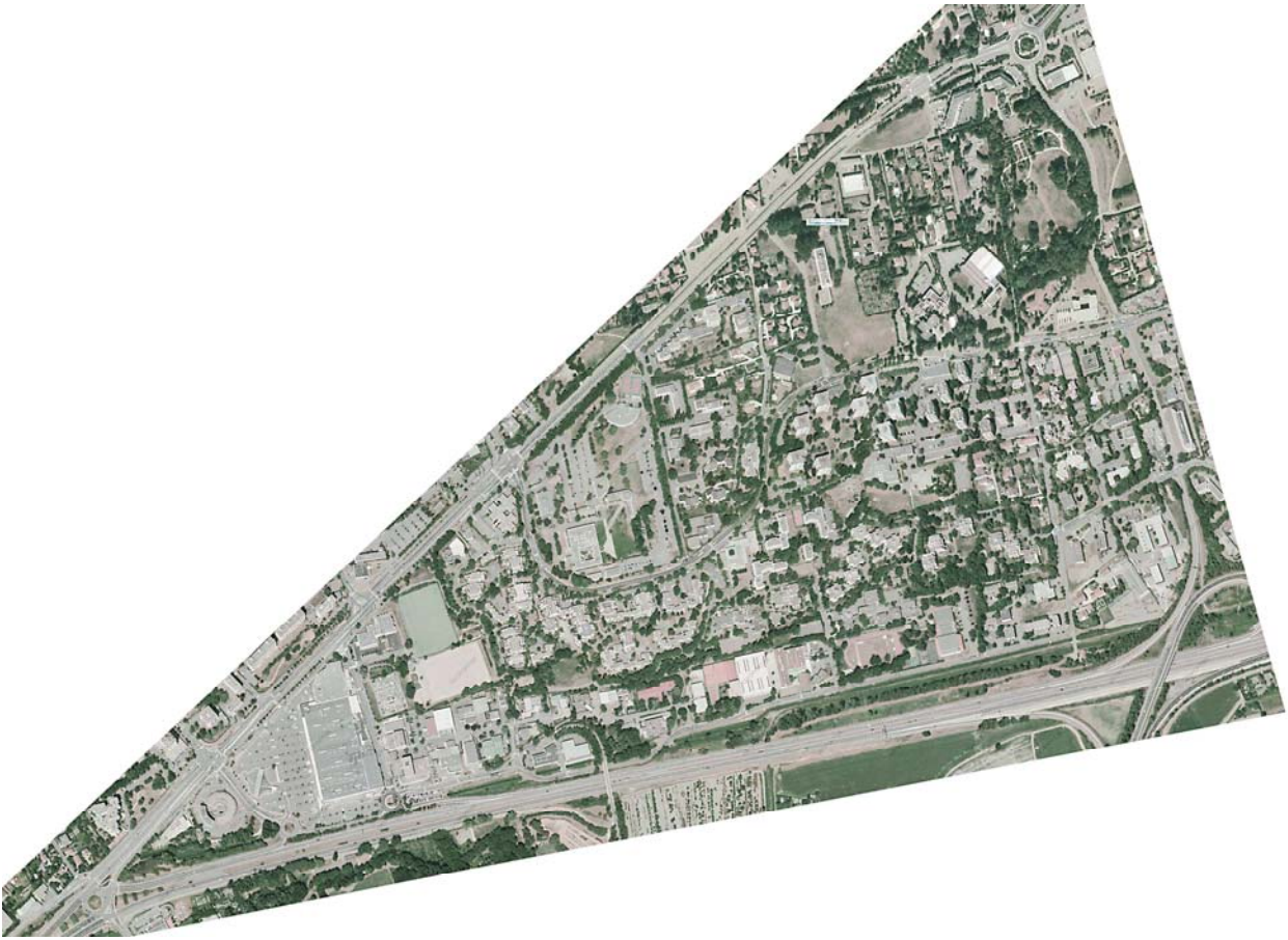
Vue aérienne du quartier Buclos Grand Pré – trame verte existante