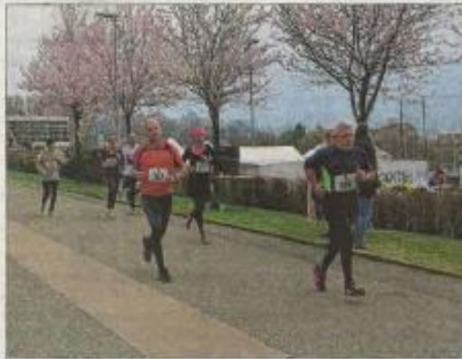
Course de 5 km ou de 10 km, marche sur 5 km chronométrée ou non, les coureurs, dès 14 ans, pouvaient choisir leur épreuve préférée.