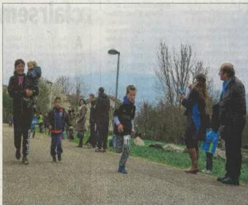
Les enfants étaient répartis en trois catégories : les 8-9 ans couraient un kilomètre, les 10-11 ans faisaient deux kilomètres et les 12-13 ans, trois kilomètres.