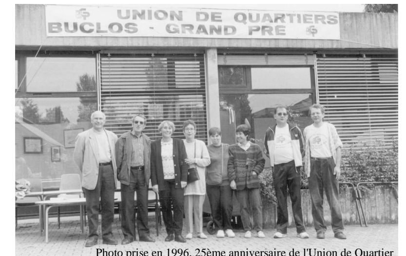
Photo prise en 1996, 25ème anniversaire de l'Union de Quartier

Assemblée générale Jeudi 20 septembre A 20 h30 au HABERT Suivie d'une collation amicale