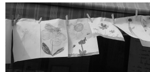
Fête des Fleurs 2003

Celle salle peut aussi être mise à disposition de nos adhérents pour une utilisation privée. Mais pour ne pas alourdir la charge des bénévoles qui en assurent la gestion, cette possibilité est réservée à nos « vrais » adhérents, qui ont payé leur cotisation en début d'année scolaire. D'autre part, les règles municipales en interdisent l'usage au-delà de 22 heures.