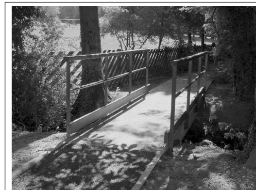
Le nouveau petit pont, de bois, de fer, et de béton

Jeudi 25 septembre A 20 h30 au HABERT Suivie d'une collation amicale