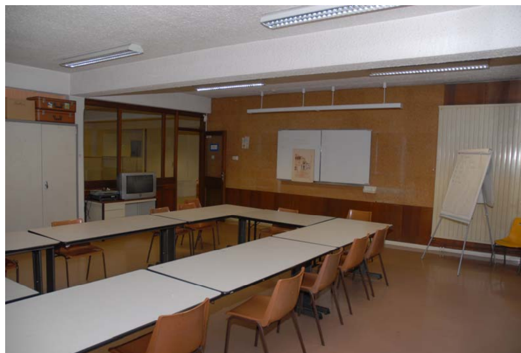
La nouvelle salle d'activités de l'UQBGP

Un grand merci à toutes celles et ceux du quartier qui ont participé à cette opération, sans oublier le personnel mis à notre disposition par le Centre Technique de la Ville. Tous furent très efficaces.